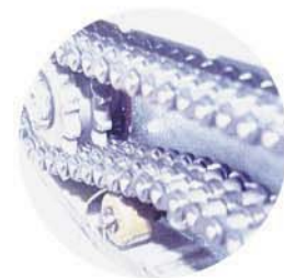
Partial photograph of rotary tillage chain

Fotografía parcial de la cadena para la labranza rotatoria