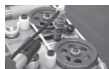
LKS B 00